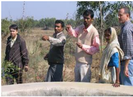
សម្ភារៈ និងការតភ្ជាប់ជាមួយនឹងទីផ្សារ។

គាំទ្រដល់សមាជិកភាពក្រុមទាំងឡាយដែលបានរៀបចំទម្រង់បែបបទបានគ្រប់គ្រាន់ ហើយតែងតែពាក់ព័ន្ធដល់ជនទាំងឡាយណាដែលយល់ព្រម និងទទួលយកនូវច្បាប់ និងរបៀបរបបទាំងអស់នោះ និងឯកភាពផងដែរចំពោះវិន័យដែលត្រូវប្រកាន់យក ក្នុងករណីបើមានជនណាមួយមិនគោរពតាមច្បាប់ទាំងនោះ។