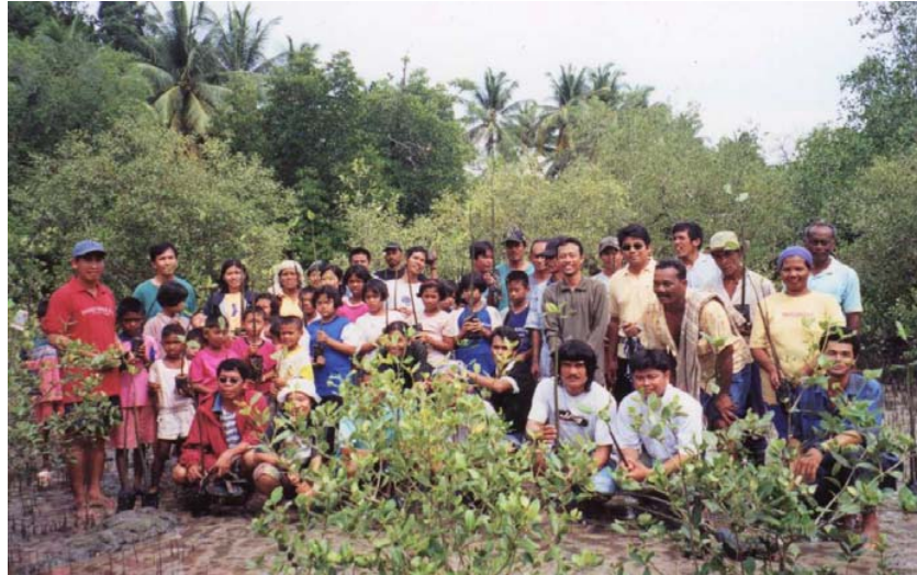
Ka Uper (may antipara, una nga raya sa wala) upod sa mga mangingisda kag partisipante sang SPARK study tour sa katunggan sa sur nga bahin sang Thailand

Ang amon organisasyon nagadumala subong sang tatlo ka 200x100 ka metro nga sangtuwaryo sang isda nga ginatagaan pundo sang gobyerno-lokal. Nagapartipisar kami sa isa ka 45-hektariya nga mangrove reforestation project nga ginapunduhan sang Oxfam, isa ka British nga NGO, kag PACAP, isa ka Australian funding agency . Isa sa amon miyembro, nangin chairperson sang isa ka bay-wide Fisheries and Aquatic Resource Management Council (FARMC) nga nagarekomendar sa gobyerno-lokal sang mga polisa nga may kaangtanan sa pagdumala sang dunang manggad sa kadagatan. Aktibo man kami sa kampanya batok sa ilegal nga pagpangisda sa bulig sang mga miyembro sang national media . Nakumbinse namon ang mga utoridad nga indi pagtugutan ang pag-operar sang isa ka paktorya sang semento nga makahalit sang amon katunggan kag makapahigko sang amon nga lugar palangisdaan. Nagapartipisar man kami sa pagproteher sang nabilin nga takot ukon bahura (coral reefs) sa Pagapas Bay sa Calatagan sa suporta sang gobyerno-lokal. Sini, napilian ako nga miyembro sang nasyonal nga konseho sang National Anti-Poverty Commission (NAPC).