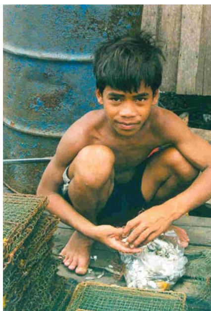
Ang CFDO nagabulig para maagum ang direcho sa pagpangisda para sa mga iimol nga mga mangingisda paagi sa co-management.

Upod sa mga ahensiya panggobyerno sang Bangladesh, Lao PDR and Vietnam, ang CFDO nagapartisipar sa isa ka proyekto nga ginahatagan pundo sang ICLARM para magtukib sang mga palangabuhian nga nagasalig sa inland fisheries . Ang katuyuan sang pagtuon amo ang pagtul-id sang pagsalig sang imol nga pumuluyo sa mga dunang manggad sa kadagatan, maglaragway sang "kaimulon", kag magtakos sang kahuyang sang mga imol nga tawo sa kapaslawan sa pagdumala sang dunang manggad sa kadagatan. Gina paabot nga ang impormasyon nga makuha sa apat ka mga pungsod magabulig sa mga nagadumala kag sayantipiko sang mga dunang manggad sa kadagatan, nga mahangpan ang kaangtanan sa tunga sang imol kag sang dunang manggad. Ang isa ka ginatagaan sang atensiyon amo ang palaabuton nga iprayuridang nga pagtuon kag mga masudlan nga anggulo (entry points) para mapahaganhagan ang kaimulon.