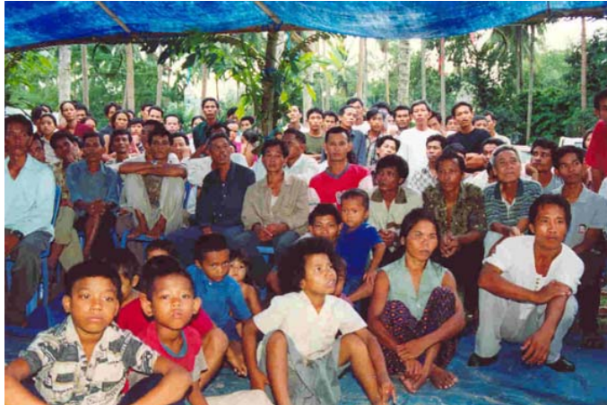
Reporma sa pangisdaan kag pagdumala nga nakabase sa komunidad ang nagahatag tingog sa mga nagagamit sang dunang manggad sa kadagatan. Sa diri ang komunidad nagahulat sang resulta sa pagpiniliay sang komite.