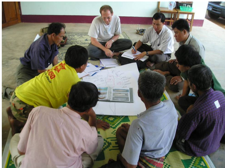
Katapo sang Lao PDR fisheries agencies, Living Aquatic Resources Research Center and Department of Livestock and Fisheries, nagatan-aw sang local nga kinaalam sa pangisda sa madalum nga mga bahin sang Mekong, Khong Island, Champassak Province.