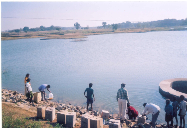
Getalsud Reservoir, Ranchi District, Jharkhand

Ang mga mangingisda nagagamit sang monofilament nylon nets , nga may magamay sang mata kag delikado kay nagakadala dakop ang fingerlings nga amo ang nagresulto sang pagdiutay sang populasyon sang isda sa palaabuton. Gani ang kakulangan sang pagbuhi sang isda