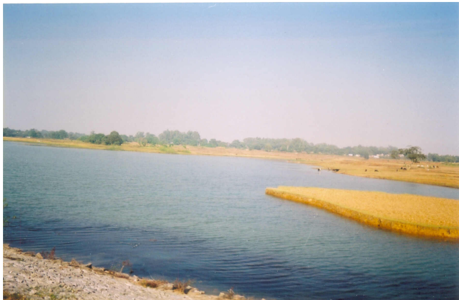
Bucha Opa Reservoir, Ranchi District, Jharkhand

Ang iban nga mayor nga mga departamento nagaplastar sang mga reservoir paagi sa pagsubasta, samptang madamo pa ang wala nagakabalaka sa sini nga mga buluhaton. Ang mga mangingisda – nga ginakilala nga mga imol kag pigado sa sosyudad – nagapangalag-ag sa pagpati sa mga mabaskug nga mga lokal nga lalake. Kon magkadto sila sa DoF nahanungod sa kakulangan sang