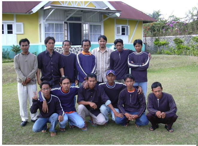
Si Mr Mauksit ikatlo nga sa gatindog halin sa tuo upod sa grupo sang mga manugpunong sang gulaman

Sang umpisa, ang kumpaniya regular nga nagabisita kag naga-estorya sa tagsa ka mga tag-iya sang punong. Sang nagadamo na ang mga nagatanum sang gulaman, ang tanan naghisugot nga kinahanglan na nga magporma sang grupo para mahapos ang magkomunikar kag magpalapta sang balita sa mga manugpunong. Ang ini nga grupo na-establisar nga may pormal nga estruktura, nga nagalakip sang Pinuno, Sekretarya, Tresurero, kag iban pa nga pinuno sang mga komite. Bangud sa pag-establisar sang grupo, nangin mahapos para sa kumpaniya ang maghatag sang teknikal nga bulig kag mga simple nga pamaagi sa pagdumala katulad sang record-keeping paagi sa journal, basic accountancy kag bookkeeping , business planning , budgeting kag pagdumala sang tawo.