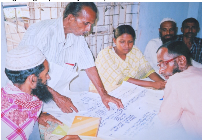
Mga stakeholders nagapat-ud sang kinahanglanon nila nga impormasyon kag mga oportunidad sa pagbaylohanay sang impormasyon sa Bangladesh.

Part I: Ang Practical Guide ginsulat para gid sa mga co-managers kag manugpatigayon ukon facilitators nga nagatrabaho sa field . Nagahatag ini sang simple kag praktikal nga laygay sa pagbulig sa mga stakeholders sa pagpat-ud sang ila kinahanglanon nga impormasyon nga may kaangtanan sa ila katutyuan sa pagdumala kag mga responsibilidad, kag sa paghimo sang buyloganay nga pamaagi sa pagkolekta kag paghatagay sang impormasyon sa pinaka-epektibo nga pamaagi.