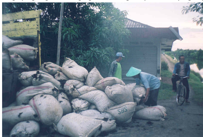
Ang mga manugpunong gabuligay sa pagkuha sang similya sang Gracilaria sp.

Ang kompanya nagpakilala sa mga manugpunong sang bag-o nga sahi sa pag-obra nga sa diin ang pagsagud sang gulaman gin-upod sa pagsagud sang lukon kag bangrus sa isa ka